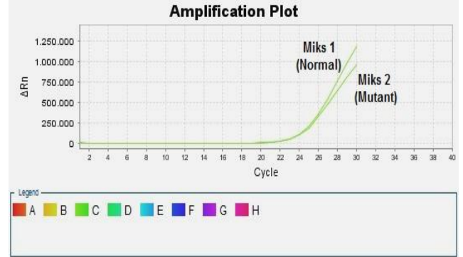
Şekil 3: FII Heterozigot (Miks 1 – Miks 2, FAM)