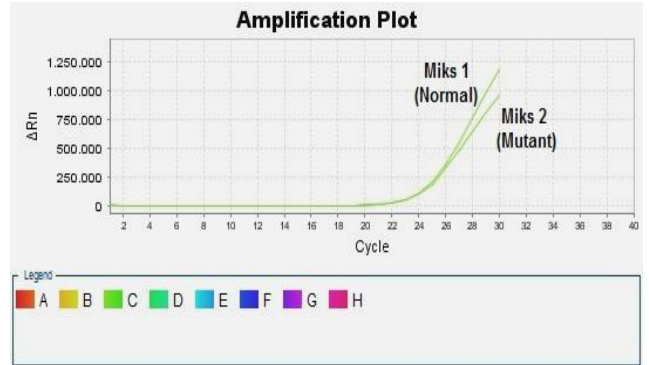
Şekil 3: FII Heterozigot (Miks 1 – Miks 2, FAM)