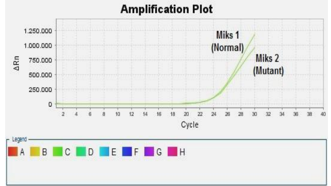
Şekil 3: FII Heterozigot (Miks 1 – Miks 2, FAM)