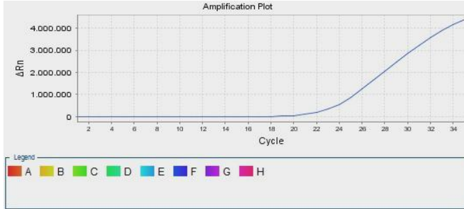
Şekil 2: HLA B5 Pozitif Örnek (FAM Boyası)

İnternal Kontrol pikleri HEX/JOE boyası ile analiz edilmelidir. DNA eklenmiş tüm kuyularda internal kontrol pikleri gözlenmelidir. CT değeri ise 20 \leq ct \leq 26 aralığında olmalıdır (Şekil: 1)