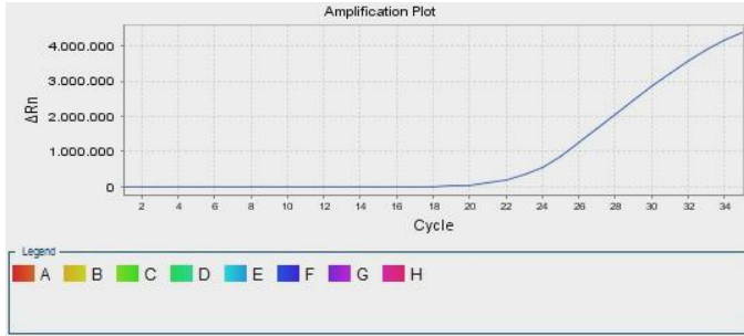
Şekil 2: HLA B57 Pozitif Örnek (FAM Boyası)

İnternal Kontrol pikleri HEX/JOE boyası ile analiz edilmelidir. DNA eklenmiş tüm kuyularda internal kontrol pikleri gözlenmelidir. CT değeri ise 20 \leq ct \leq 26 aralığında olmalıdır (Şekil: 1)