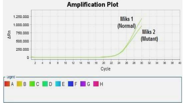
Şekil 3: FII Heterozigot (Miks 1 – Miks 2, FAM)